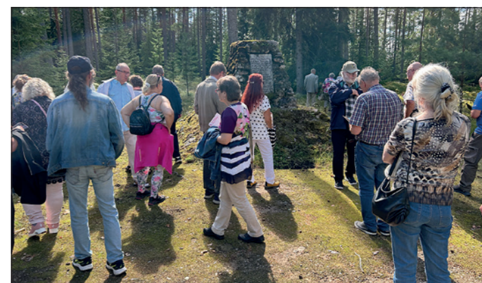
Varkausmäen nälkään kuolleiden muistomerkki ja hautausmaa, jossa lepää 281 nälkävuonna 1868 kuollutta vainajaa.

Palasimme bussilla Kotiseutukeskus Tyyskään, jossa vielä lopuksi vierailimme Väentuvassa ja Kalastuksen perinnehuoneessa. Päivän retkellämme saimme tutustua useisiin erilaisiin paikkoihin ja aikaa oli myös mukavasti keskusteluun retkeläisten kesken. Varkaudessa vierailijoille suosittelemme lämpimästi tutustumaan näihin kohteisiin. Kotiseutukeskus Tyyskä on myös erinomainen paikka järjestää tapahtumia. Sukuseura kiittää kaikkia retkelle osallistuneista sekä retken toteutukseen osallistuneita. Toivottavasti nähdään pian! •